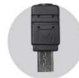
소니 RF-913 케이블 : RC-913

EOS R5, R3, 1D, 1DMark II, 1DMark III, 1DMark IV, 1Ds, 1DsMark II, 1DsMark III, 1Dx, 1DxMark II, 1DxMark III, 5D, 5DMark II, 5DMark III, 5D Mark IV, 5Ds, 5DsR, 6D, 6DMark II, 7D, 7DMark II, 50D, 40D, 30D, 20D, 10D, D60, D30 Film Camera EOS3, EOS1V HS, EOS1V