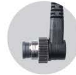
니콘 RF-903 케이블 : RC-903

OM-D E-M1, E-M5, E-M5 mark2, E-M10, E-M10 mark2 PEN PEN-F, E-P1, E-P2, E-P3, E-P5, E-PL2, E-PL3, E-PL5, E-PL6, E-PL7, E-PL8, E-PM1, E-PM2, E620, E520, E510, E-450, E420, E30, E410, E400, SP-820UZ, SP-810UZ, SP-720UZ, SP-620UZ, SP-590UZ, SP-570UZ, SP-565UZ, SP-560UZ, SP-550UZ, SP-510UZ