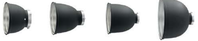
표준 리플렉터 미디엄 리플렉터 네로우 리플렉터 빔 리플렉터