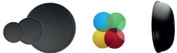
허니컴 그리드 HC-120 / HC-170 / HC-300 컬러필터 BR-300 리플렉터 (화이트/실버)