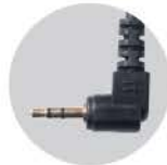
후지필름 RF-905 케이블 : RC-905

EOS R10, R8, R7, R6, R, RP, 1300D, 1100D, 1000D, 850D, 800D, 760D, 750D, 700D, 650D, 600D, 550D, 500D, 450D, 400D, 350D, 300D, 200D II, 200D, 100D, 90D, 80D, 77D, 70D, 60D, EOS 30, 50, 500N, Kiss, 300, 88, 66, 55, M5, M6, M6 mark II Power shot G1X, G10, G11, G12, G15, SX50HS, SX60HS, SX70HS, EOS Hi, EOS 70D, G3X, G5X, G16, G1X Mark II