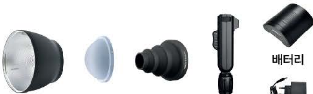
표준리플렉터 돔디퓨저 B Snoot 90 앵글그립 배터리 충전기