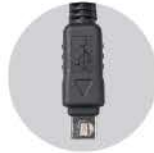
올림푸스 RF-902 케이블 : RC-902

OM-D E-M1, E-M5, E-M5 mark2, E-M10, E-M10 mark2 PEN PEN-F, E-P1, E-P2, E-P3, E-P5, E-PL2, E-PL3, E-PL5, E-PL6, E-PL7, E-PL8, E-PM1, E-PM2, E620, E520, E510, E-450, E420, E30, E410, E400, SP-820UZ, SP-810UZ, SP-720UZ, SP-620UZ, SP-590UZ, SP-570UZ, SP-565UZ, SP-560UZ, SP-550UZ, SP-510UZ