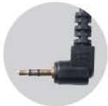
캐논 RF-905 케이블 : RC-905

Z8, Z9, D850, D810, D800, D800E, D700, D500, D300, D300s, D200, D100 (배터리그림필요) D5, D4, D4S, D3, D3S, D3X, D2, D2X, D2Xs, D2Hs, D2H, D1H, D1, F6, F100, F90X, F90