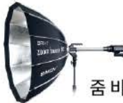
줌 바운스 - 100