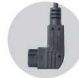
소니 RF-907 케이블 : RC-907

GFX100, GFX100S, GFX50S II, GFX50S, GFX50R, X-H1, X-PRO3, X-PRO2, X-T5, X-T4, X-T3, X-T2, X-T1, X-T30 II, X-T30, X-T20, X-T10, X-T100, X-E4, X-E3, X-E2S, X-E2, X-E1, X-A7, X-A5, X-A10, X100V, X100F, X100T, X70, X30, XF10, X-H2S