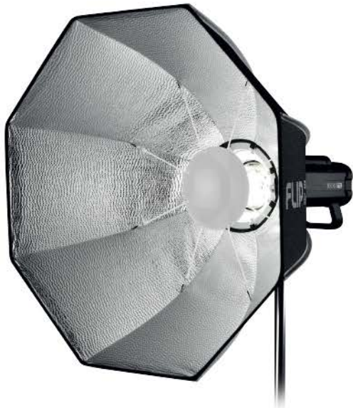
FLIP Beauty 24 (직경 60cm)

중앙에 집중되는 광원의 빛을 반사경으로 막아주는 동시에 재반사효과를 내어 좀 더 화사하고 선명한 빛을 연출할 수 있는 뷰티디쉬 제품입니다. 고정된 형태를 가진 기존 제품들과 달리 플립 형식을 적용하여 부피와 무게를 확 줄이고 휴대성을 높였습니다.