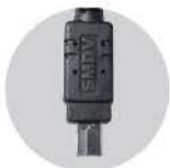
니콘 RF-908 케이블 : RC-908

a900, a850, a700, a580, a560, a550, a500, a450, a350, a300, a200, a100, a99, a99 II, a77, a77 II, a65, a57, a55, a35, a33, a5