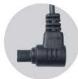
캐논 T811 케이블 : RC-T811

Z5, Z6, Z6 II, Z7, Z7 II, D90, D780, D750, D600, D610, D3100, D3200, D3300, D5000, D5100, D5200, D5300, D5500, D5600, D7000, D7100, D7200, D7500, COOLPIX A, COOLPIX P7700, COOLPIX P1000, Df