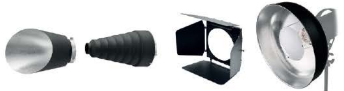
백 리플렉터 스누트 리플렉터 반도어 리플렉터 뷰티디쉬 리플렉터