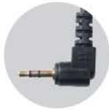
캐논 T805 케이블 : RC-T805

Z8, Z9, D850, D810, D800, E800E, D700, D500, D300, D300s, D200, D100 (배터리그립필요) D5, D4, D4S, D3, D3S, D3X, D2, D2X, D2Xs, D2Hs, D2H, D1H, D1, F6, F100, F90X, F90