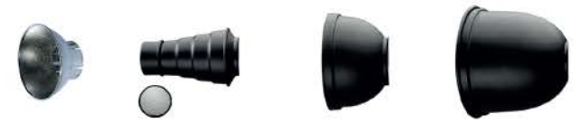
BR-햇스팟 리플렉터 BR-40 리플렉터 BR-120 리플렉터 BR-170 리플렉터