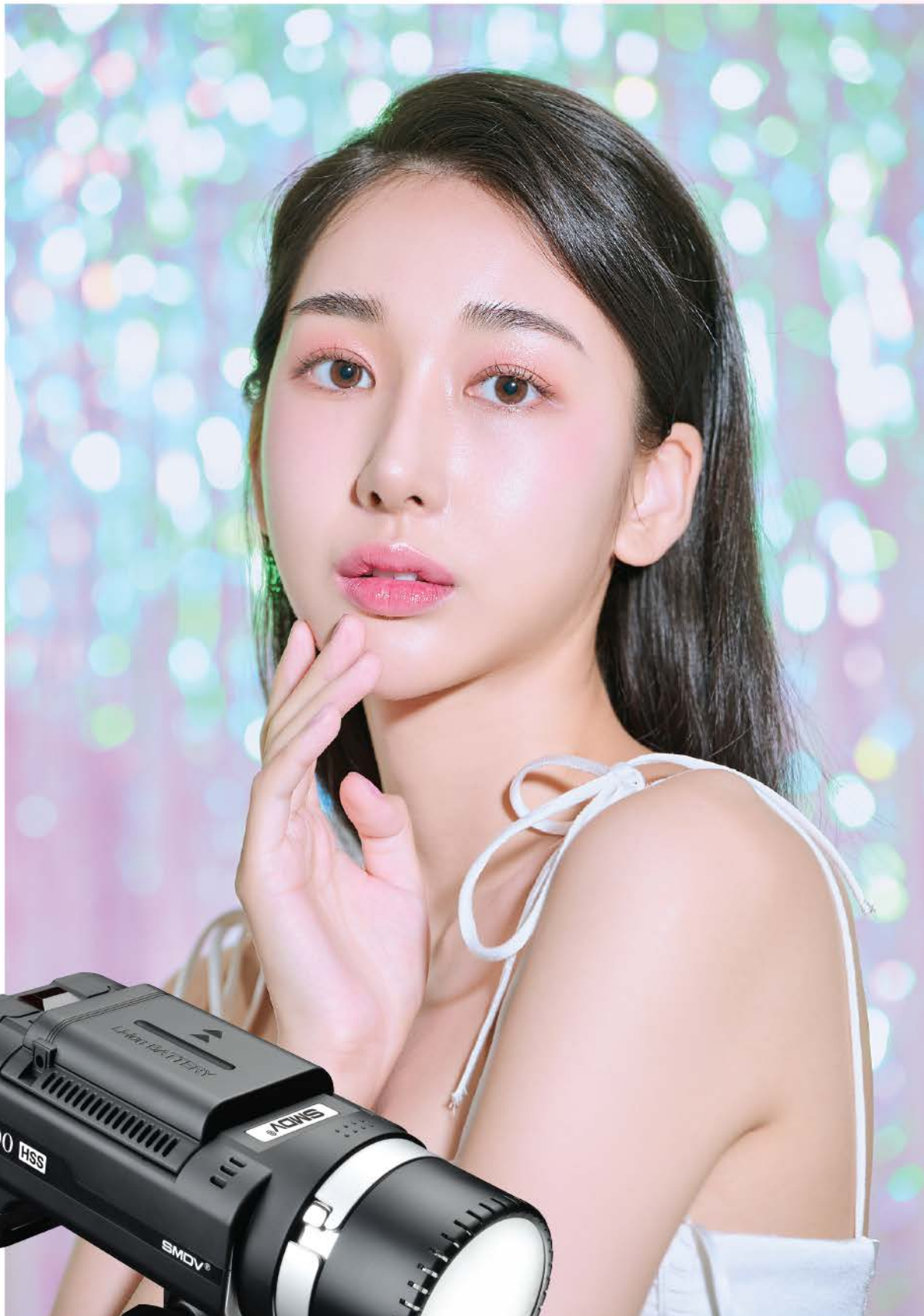
500W Strobe - B500 TTL / B500 HSS