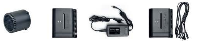
BR-80 B500 전용 B-02 배터리 B500 전용 배터리충전기 B500 전용 배터리 AC Pack B500 전용