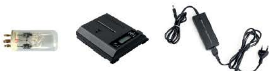
플래시튜브 배터리 배터리충전기