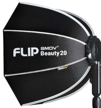
FLIP Beauty 20 (직경 50cm)