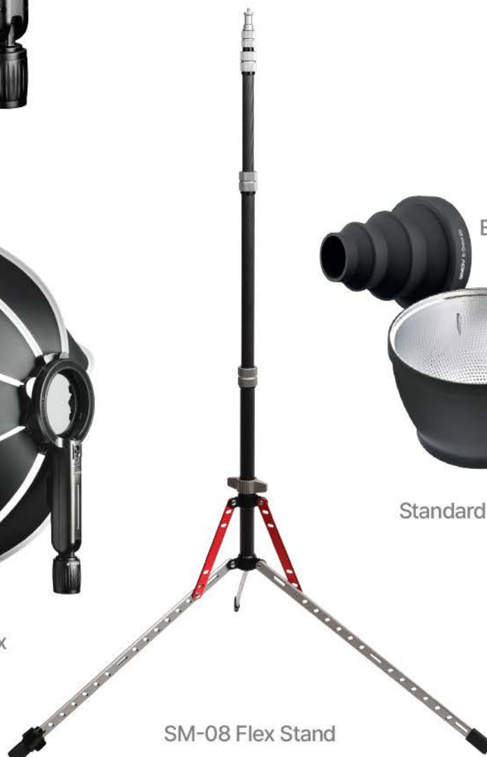
SM-08 Flex Stand