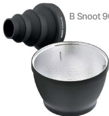
B Snoot 90