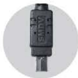
니콘 T808 케이블 : RC-T808

a900, a850, a700, a580, a560, a550, a500, a450, a350, a300, a200, a100, a99, a99 II, a77, a77 II, a65, a57, a55, a35, a33, a5