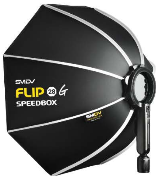
Flip G Series Softbox